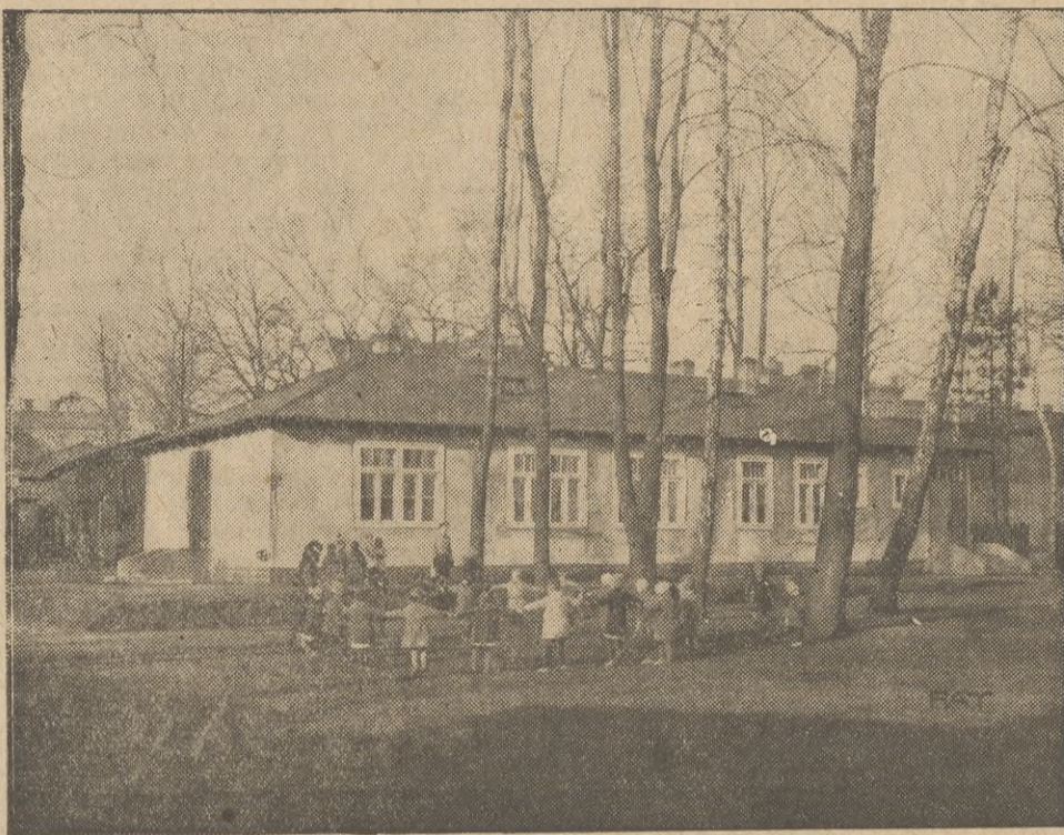
W listopadzie b. r. otwarte zostały na G. Śląsku liczne przedszkola. W Tarnowskich Górach pomieszczone jest ono w budynku nawskróś nowoczesnym, zbudowanym z masy polimutowej systemu dr. Hofmoka. Uczęszcza do niego przeszło 40 dzieci. Zdjęcie przedstawia grupę dzieci, bawiących się przed budynkiem przedszkola w Tarnowskich Górach.