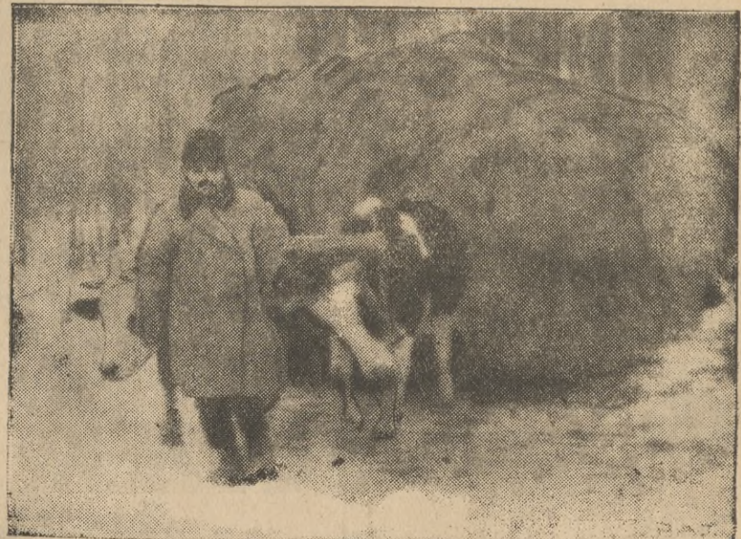
Na ilustracji na tle smętnego i monotonnego krajobrazu poleskiego, chłop zwożący siano przy pomocy krowiego zaprzęgu.