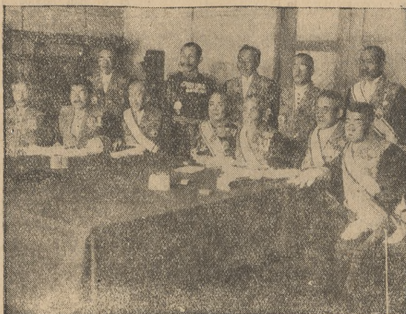
Członkowie nowego gabinetu japońskiego.

przeznaczają dla Lwowa żadnych funduszy. Wobec tego smutnego stanu rzeczy wybrana została specjalna delegacja, która ma interwenjować u wszystkich czynników miejscowych i w Warszawie, aby zwrócić uwagę na ogromną doniosłość tej sprawy i spowodować przeznaczenie środków na akcję budowlaną. W tej sprawie odbędzie się w przyszły wtorek specjalne zgromadzenie.