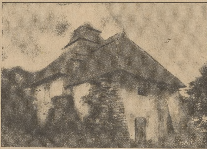
Cerkiewka w Czesnikach, koło Rohatyna, która dawniej była zborem arjańskim. Jest to interesujący typ budownictwa późnego renesansu. Charakterystyczna sylweta gontowego dachu posiada jednak wybitny związek z miejscową tradycją artystyczną. Cerkiewka ta została niedawno odnowiona.