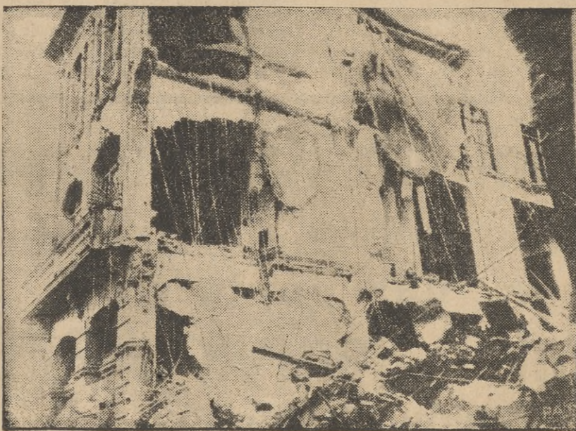
Miasto Santiago na Kubie padło niedawno ofiarą trzęsienia ziemi, które przetrzęsło trzecią część miasta. W czasie trzęsienia ziemi, kilkadziesiąt osób zginęło, kilkaset zostało rannych. Na zdjęciu front zniszczonego trzęsieniem ziemi domu.