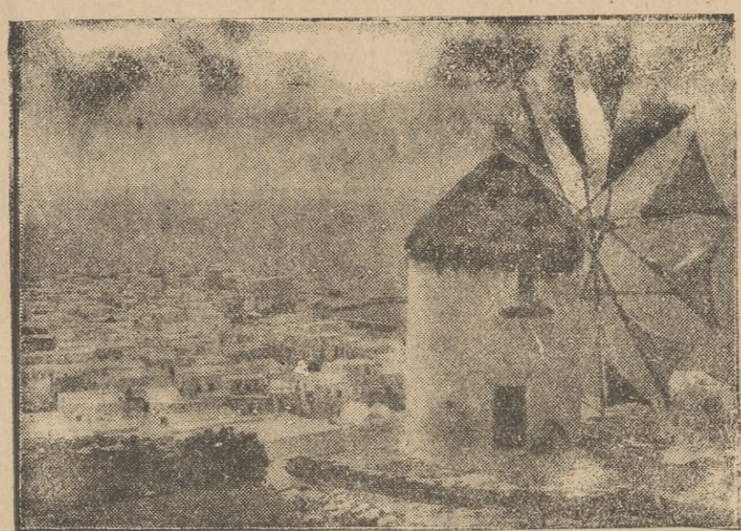
Ilustracja przedstawia piękny widoczek z wyspy Mykonos (Cyklady wschodnie), ze staroświeckim wiatrakiem.