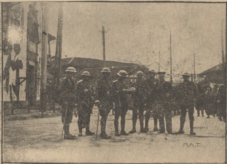
Oddział żołnierzy angielskich, strzegących dostępu do koncesji międzynarod. w Szanghaju.