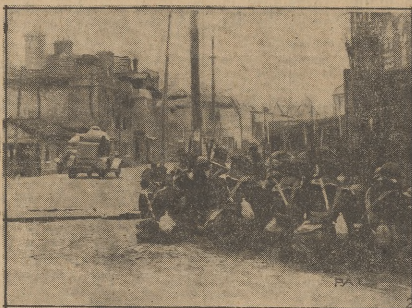
Fragment z walk walk japońsko-chińskich w Szanghaju. Poza barykadą ukryty czuwa oddział japońskich strzelców morskich którego do pomocy dodano samochód pancerny.