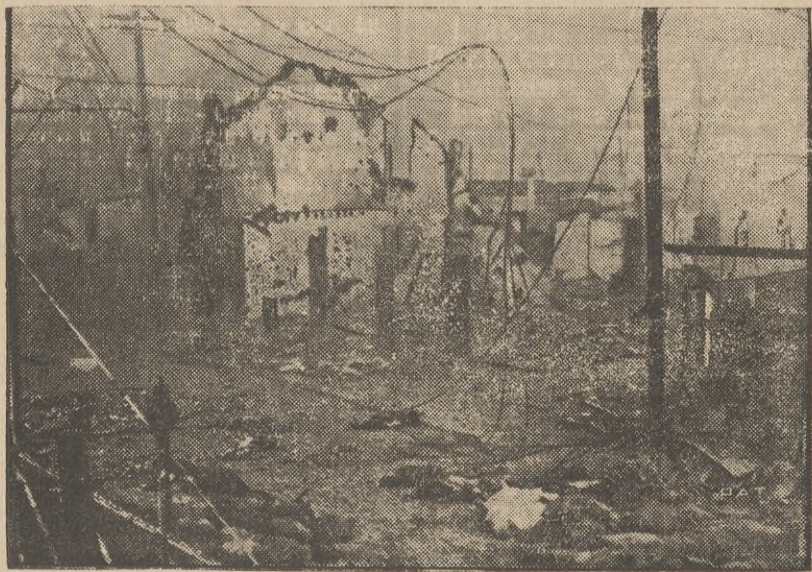
Ofiarą krwawych i zaciętych walk, toczących skimi w Szanghaju padła dzielnica chińska tego Na zdjęciu fragment zniszczonego miasta, resztki

się od dłuższego czasu między wojskami japoń- miasta która uległa całkowitemu zniszczeniu. murów i zniszczonych przewodów elektrycznych.