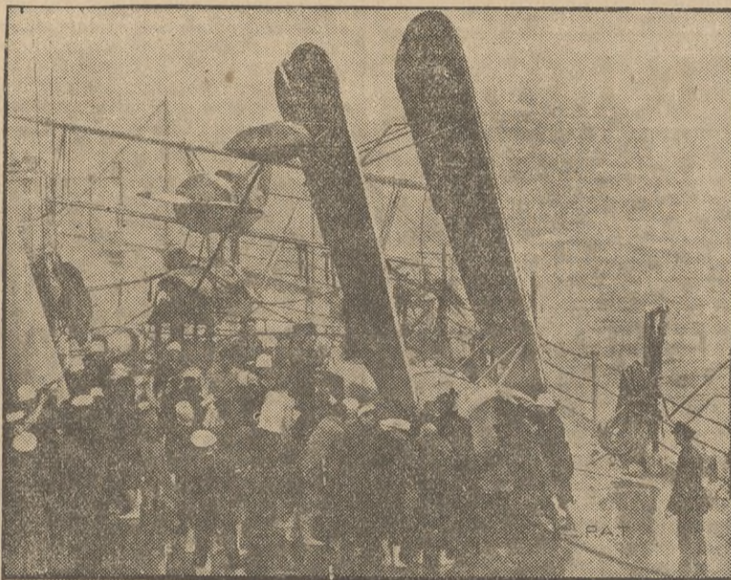
Amerykański okręt wojenny „New York“ udający się przed kilku dniami na manewry marynarki w kierunku wysp Hawajskich dostał się w Hw strefie gwałtownej burzy, przyczem znajdujący się na jego pokładzie samolot uległ zupełnemu zniszczeniu. Na zdjęciu marynarze załogi okrętu wojennego usuwają z pokładu szczątki zniszczonego samolotu.